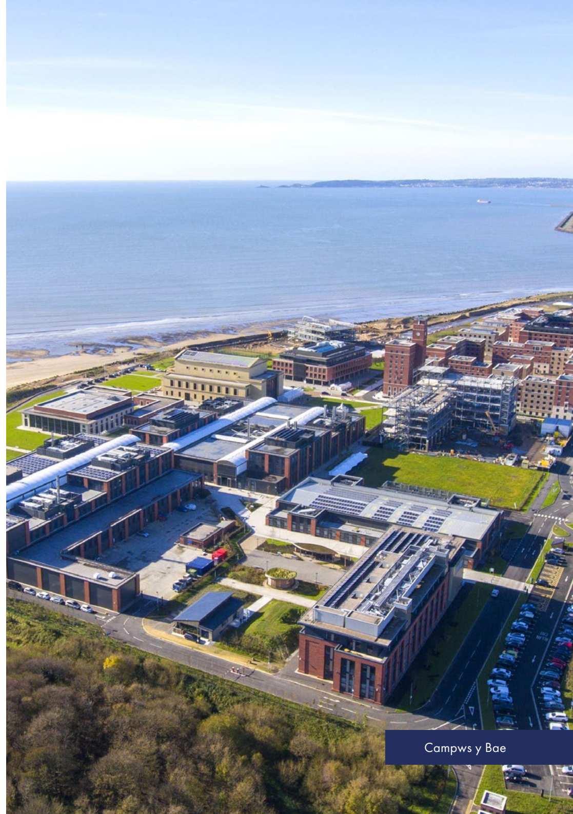
Campws y Bae

Enghraifft ddisglair o gydweithio arloesol rhwng ymchwilwyr a diwydiant, a fydd yn denu rhagor o gyllid ar gyfer ymchwil ac yn sefydlu Cymru fel canolfan cyfrifiadureg ac arloesi sy'n arwain y ffordd yn fyd-eang. Prif Weinidog Cymru, 2018