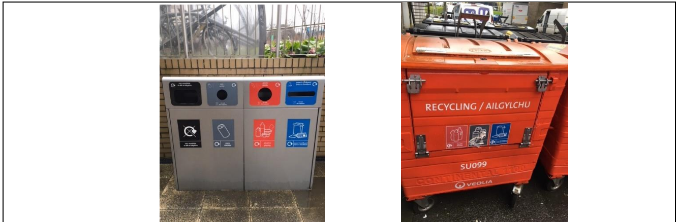
Ffigwr 2: - Biniau pedair adran a biniau contractwyr ar safleoedd Prifysgol Abertawe

Ar ôl iddynt gael eu casglu, bydd sachau bin clir yn cael eu rhoi yn y biniau pwrpasol mwy (a ddarperir gan y contractwr rheoli gwastraff), sydd i'w cael mewn mannau dynodedig ar ystadau'r Brifysgol.