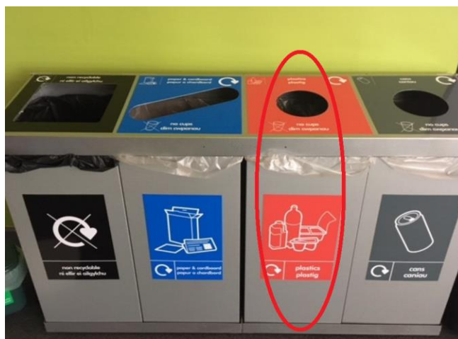
Ffigwr 1 - Biniau pedair adran mewnol Prifysgol Abertawe

Ni ddylid rhoi plastig mewn unrhyw finiau ond y biniau pedair/dwy adran metel sy'n agor ar y pen. Bydd yr holl finiau wedi'u labelu fel "Plastig" ac yn cynnwys sach bin glir. Ni ddylid defnyddio biniau personol/dan y ddesg mewn swyddfeydd gan nad yw hyn yn annog pobl i ailgylchu.